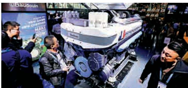
法企博杜安在進博會展出一台柴油發動機

中國經濟之所以能快速持續發展，得益於「改革開放」不斷深化。未來中國發展的動力也必然建立在深入改革、加大對外開放的基礎上。可以預見，中國將營建一個權利平等、規則平等、機會平等的環境，讓所有看好中國經濟、願意投資中國的外國公司分享中國市場。