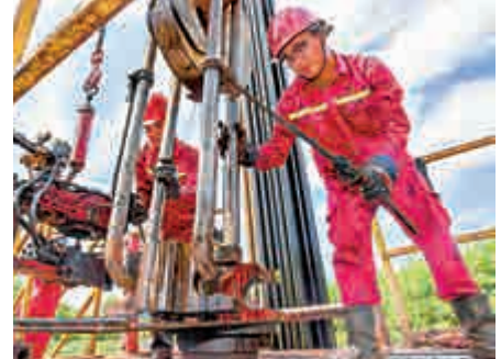
▲海南福山油田工人在工作中 資料圖片

第一，共享國際油氣合作新機遇。首先是積極推進「一帶一路」沿線能源合作，增強沿線各國在開放條件下的能源安全保障能力，帶動沿線國家的資源開發與能源建設。二是推動能源貿易、投資和產能