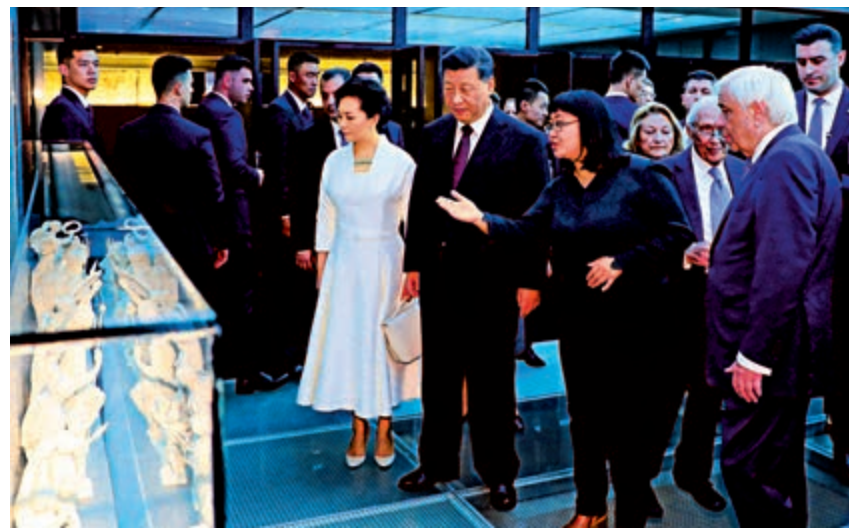
▲12日，習近平和彭麗媛參觀雅典衛城博物館。

習近平高度讚賞齊普拉斯擔任希臘總理期間為推動中希友好合作所作的努力，希望齊普拉斯和其領導的政黨繼續支持中希關係發展。習近平指出，國與國交往既要講利，更要重義。贈人玫瑰，手有餘香。中方始終堅定支持希臘政府和人民應對金融危機影響，堅定推進兩國務實合作。