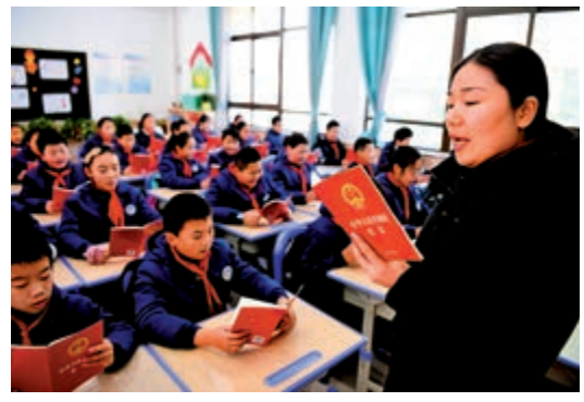
▲安徽合肥的學校老師於國家憲法日在課堂上講解憲法知識