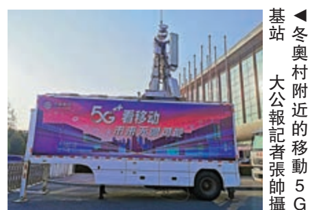
▲冬奧村附近的移動5G基站

北京冬奧村項目主體結構，近日已全部封頂。到2022年北京冬奧舉辦時，冬奧村屆時將為各國運動員及隨隊官員提供住宿、餐飲、醫療等保障服務。此外，北京冬奧村還將全面覆蓋5G信號，為各國運動員提供便利。北京有關方面透露，冬奧村項目整體預計到明年年底基本完工。（記者 張帥）