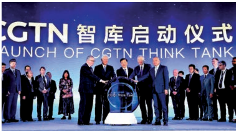
▲中宣部副部長、中央廣播電視總台台長慎海雄（前右三）與其他嘉賓共同啟動CGTN智庫

CGTN在峰會上宣布，CGTN正式入駐亞馬遜流媒體平台Fire TV。在這個平台上的CGTN Now能提供CGTN英語頻道電視直播內容和原創內容點播。CGTN還與微軟新聞簽署了合作協議，允許微軟新聞抓取並傳播CGTN的新聞內容。