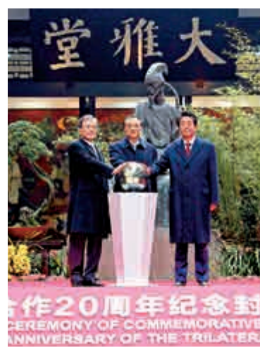
▲中日韓領導人24日在「中日韓合作20周年紀念封」發行儀式上

在大雅堂外庭院，三國領導人共同出席「中日韓合作20周年紀念封」發行儀式。參觀紀念中日韓合作20周年圖片展後，三國領導人共同種下一棵桂花樹，為它培土、澆水。李克強說，這棵象徵中日韓友誼的桂花樹一定會根深葉茂，茁壯成長。