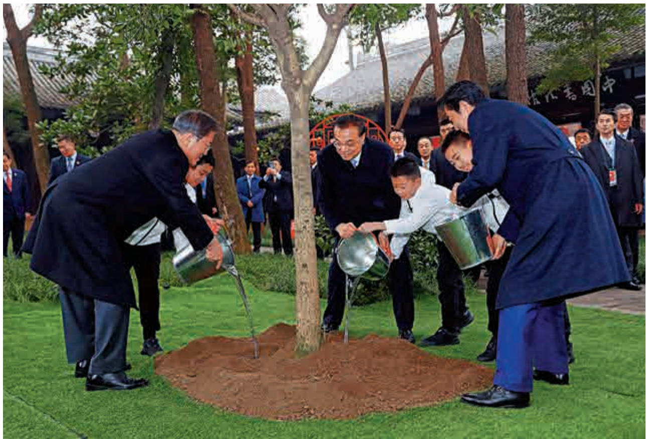
▲24日，國務院總理李克強在四川成都杜甫草堂博物館與韓國總統文在寅（左一）、日本首相安倍晉三（右一）共同出席中日韓合作20周年紀念活動，共同種下一棵桂花樹