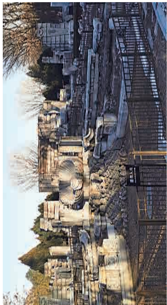
▲圓明園海晏堂及「十二生肖水鐘」廢墟

水力鐘噴泉水源，來自海晏堂後工字樓中段平台上的「錫海」，是用鉛板焊接製成的蓄水池，一次蓄水一百六十二噸，可供海晏堂水力鐘和環瀾觀前「大水法」這兩組噴泉用水。清代宮殿屋頂琉璃瓦下，也有一層用於防滲水的焊接鉛板，也寫稱「錫背」，所以筆者推測「錫海」也是鉛板製成的。如今在海晏堂遺址的軍事部，有一座巨大的三合土台基，台基上面就是當年「錫海」位置。