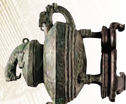
▲圓明園被劫文物——西周青銅虎尊 現藏中國國家博物館

乾隆四十六年（一七八二年），乾隆帝令宮廷如意館滿族畫師伊蘭泰，以西法繪製了一套西洋樓景區銅版畫，以拓印製傳播。伊蘭泰起稿畫小樣，造辦處匠師刻版，至五十一年（一七八六年）完成。全圖共二十幅，其中第十至第十三幅為海晏堂，對西面、後蓄水樓北面、東面、南面，進行了詳細記錄。「海晏堂西面十一」頁，十二生肖時辰鐘歷歷在目。圓明園遭劫時，這套銅版也未幸免於難，至今只能看到印刷物。