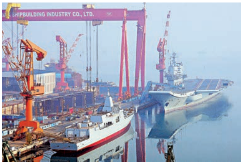
山東艦返大連 遇上055大驅

▲元旦下午，山東艦海上「跨年」後，返抵大連造船廠，與不久前下水的中國第六艘055型萬噸級導彈驅逐艦「同框」。記者 宋偉