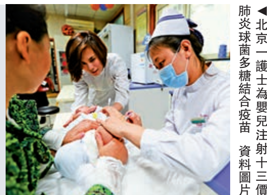
▲北京一護士為嬰兒注射十三價肺炎球菌多糖結合疫苗。資料圖片