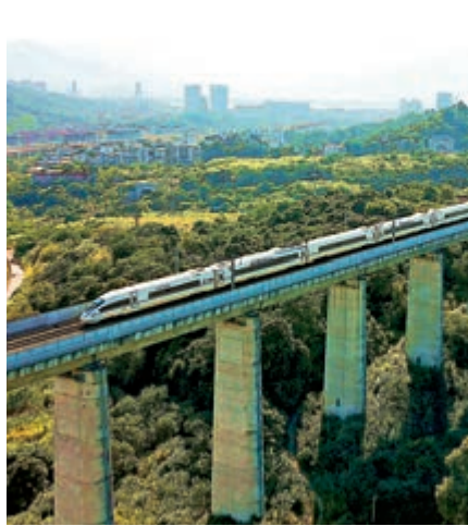
▲動車組飛馳在福州高鐵線路上。中新社

【大公報訊】據中新社報道：中國國家鐵路集團有限公司（下稱，國鐵集團）2日在北京召開的工作會議上披露，2020年國鐵集團主要工作目標確定：國家鐵路完成旅客發送量38.5億人次，貨物發送量36.5億噸；確保投產新線4000公里以上，其中高鐵2000公里。