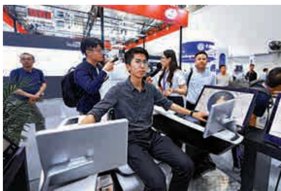
▲去年5月16日，在天津舉行的世界智能大會展示了一款船舶智能座椅

聽過委員們的發言，李鴻忠指出，過去一年，天津港澳政協委員在關鍵時刻立場堅定、旗幟鮮明、主動發聲，積極支持特區政府依法施政，捍衛「一國兩制」方針，以實際行動充分展現了強烈的政治責任擔當。他希望，各位港澳委員、各位同胞、海外華僑華人代表進一步關注天津，積極參政議政，充分發揮雙重積極作用，廣泛開展青少年交流、經貿、人文、科技、產業等領域務實合作，積極推介宣傳天津，為推進天津高質量發展作出新的更大貢獻。