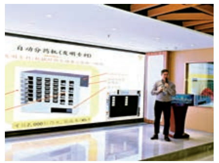
▲自動分藥機項目已連接18間老人院、醫院