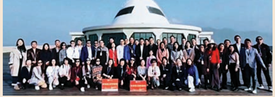
▲遊客們在人工島合影留念