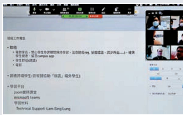
西門英才中學透過網上平台進行會議及授課，讓學生可以停課不停學。

▲全港學校因新冠肺炎而延期至三月二日才復課，幸好坊間有大量網上教學資源，讓中小學生甚至幼稚園學童可按不同學習階段及學科，自行選擇合適的題材自學。