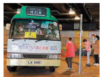
▲在黃埔花園小巴總站等候2及2A號線的乘客不多，每輛平均僅約5名乘客

納了16名舊公司的司機，現有九輛小巴行駛這兩條線，比以前少。他認為疫情下客量減少，九輛小巴足夠應付現時客量需求。