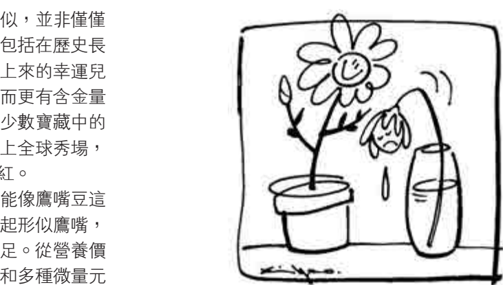
愛是持久的喜歡，喜歡是短暫的愛。

而在歷史上，這個食材還有一段隱秘而偉大的往事。詩人白居易早說過，可憐紅顏總薄命，最是無情帝王家。深宮之中因權利而殺紅了眼，可憐的不僅是紅顏，可嘆的也不止在唐朝。三個多世紀前，印度第六任皇帝奧朗則布在跟兄弟的慘烈廝殺中險勝，之後將支持哥哥的老父親軟禁，期間只允許他吃一種食物。於是鷹嘴豆就這樣，成了印度前帝王牢籠中的御食。據說當時忠誠的廚師為了讓舊主好過一些，每天想着法做不同樣式的料理，直到如今，印度一道用椰奶烹飪的招牌鷹嘴豆美食就是以老皇帝命名的。味道雖好，只是不知道當時選了鷹嘴豆的他，會是怎樣的心情。