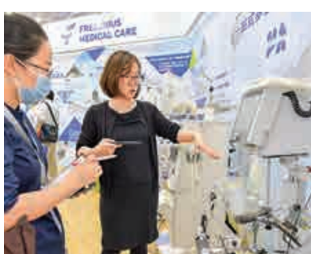
▲在海南博鰲樂城「永不落幕」國際創新藥械展上，德國費森尤斯公司工作人員介紹新款人工肺