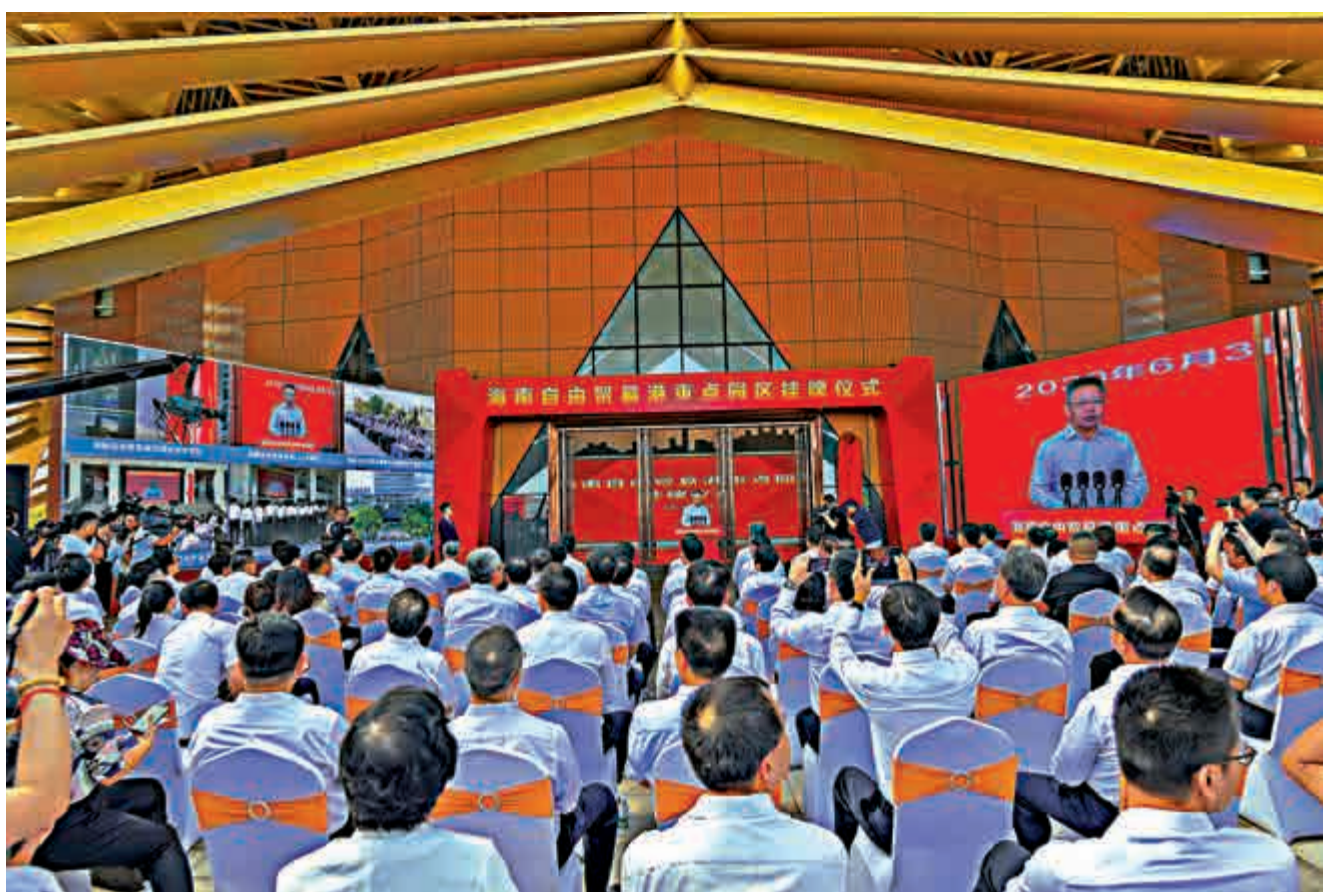
▲6月3日，海南自由貿易港11個重點園區同時掛牌。圖為海南自由貿易港重點園區掛牌儀式

此外，為鼓勵港澳台地區專業人才在海南就業創業，《港澳台地區專業人才在中國(海南)自由貿易試驗區、海南自由貿易港執業管理辦法》已從今年4月起開始實行。