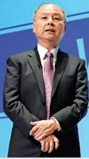
▲軟銀集團董事長孫正義