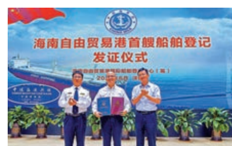
▲4日，「中國洋浦港」船舶港簽發首張《船舶國籍證書》

生產的不含進口料件或含進口料件在洋浦保稅港區加工增值超過30%（含）的貨物，出區進入境內區外銷售時，免徵進口關稅，照章徵收進口環節增值稅、消費稅。