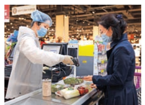
▲黑龍江哈爾濱市民在政府消費券指定超市購物

商務部新聞發言人高峰4日表示，商務部將會同有關部門，以推動發展小店經濟為主要抓手，加快小店便民化、特色化、數字化發展，推動形成多層次、多類別的小店經濟體系，促進商貿流通小微企業增加就業、擴大消費、提升經濟活力。