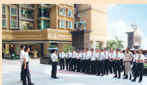
▲高衛透過持續優化培訓計劃以廣納更多專才，提高整體團隊的競爭力

由職業訓練局保安服務業訓練委員會與香港警務處合辦，保安及護衛業管理委員會支持的「保安服務最佳培訓獎選舉」，旨在鼓勵保安服務業設立長期及優質培訓計劃，以協助提升保安服務水平，強化行業專業地位。