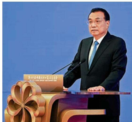
▲6月15日，中共中央政治局常委、國務院總理李克強在北京出席第127屆廣交會「雲開幕」儀式。圖為李克強在開幕式上發言。

位於唐山的惠達衛浴公司負責人告訴李克強，他們的陶瓷衛浴產品既出口海外，也在拓展內銷，特別是瞄準老舊小區改造提供適應居民需要的產品。李克強說，陶瓷是典型的傳統產業，又是一個不斷升級發展的產業，現在我們正在促消費並推動消費升級，傳統產業做好了，照樣可以挖出「金礦」。希望你們抓住新型城鎮化建設中老舊小區改造這塊「大蛋糕」，用好國家推動出口產品轉內銷的政策機遇，不斷提升品質、豐富品種，更好滿足千家萬戶需求。同時，持續提高產品競爭力，在國際市場開拓更大發展空間。李克強強調，中國是世界上最強成長性的開放大市場，我們將不斷提升進口便利化水平，增加適銷對路產品進口，讓各國企業分享中國大市場的機會。