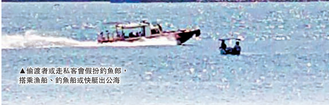
▲偷渡者或走私客會假扮釣魚郎，搭乘漁船、釣魚船或快艇出公海

港區國安法出台在即，近日亂港分子紛紛四出打探逃走路線。有船主透露，近日頻頻收到偷渡赴台的查詢電話，而海路成為亂港分子偷渡的主要途徑。大公報記者發現，西貢、香港仔、筲箕灣碼頭成為偷渡上船熱點，偷渡者到達公海再由駁船載往台灣。記者成功接洽蛇頭，獲悉近日水警布防密不透風，有亂港分子欲逃走三次均失敗而回。即使風險高但需求大，「着草費」已由月前數萬元升高至50萬到100萬不等。