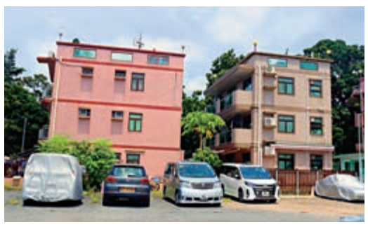
▲當年反中亂港分子租用「安全屋」安置逃犯藏身

【大公報訊】內地1989年有大量逃犯偷渡來港匿藏，再獲安排偷渡往台灣及歐美。當年的偷渡過程長達一年半載，部分逃犯潛藏香港數月甚至一年時間，香港接應的人會在西貢、大埔尾村、赤泥坪、泥涌、黃埔地的村屋租