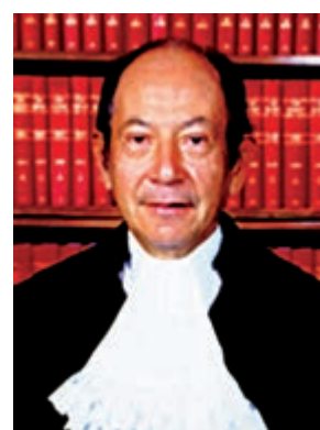
▲終審法院前常任法官烈顯倫，備受社會各界尊敬