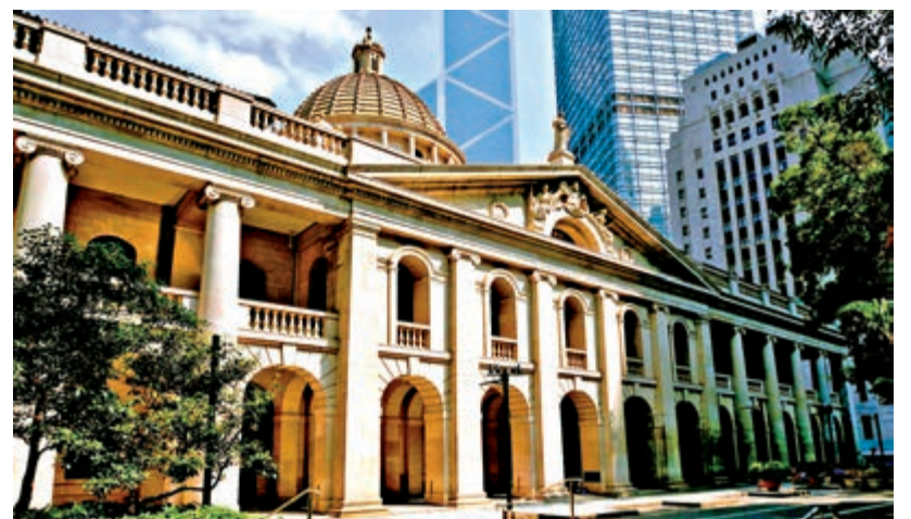
烈顯倫批評香港法庭一團糟，司法機構千瘡百孔，急需改革