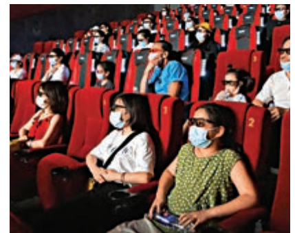
▲北京民眾8月在電影院內戴口罩觀影

疫情最早的「震中」武漢，人們也可以參加聚會、去夜店消遣，幾乎感受不到新冠病毒留下的影響。