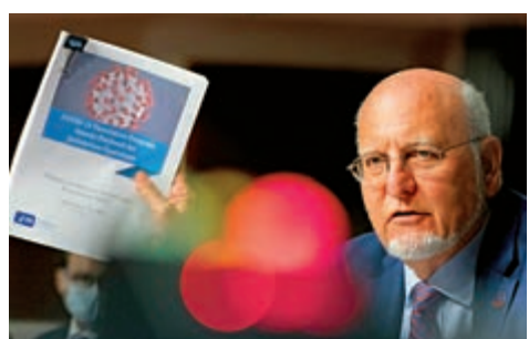
▲美國CDC主任雷德菲爾德

不過，美國衛生部助理部長吉羅伊爾回應稱，這份指引的原稿是由CDC所撰寫，其後交由白宮新冠病毒應對小組作修改，美國國家過敏症和傳染病研究所所長福奇、美國白宮負責協調疫情的官員伯克斯、特朗普疫情顧問阿特拉斯等人給予意見。