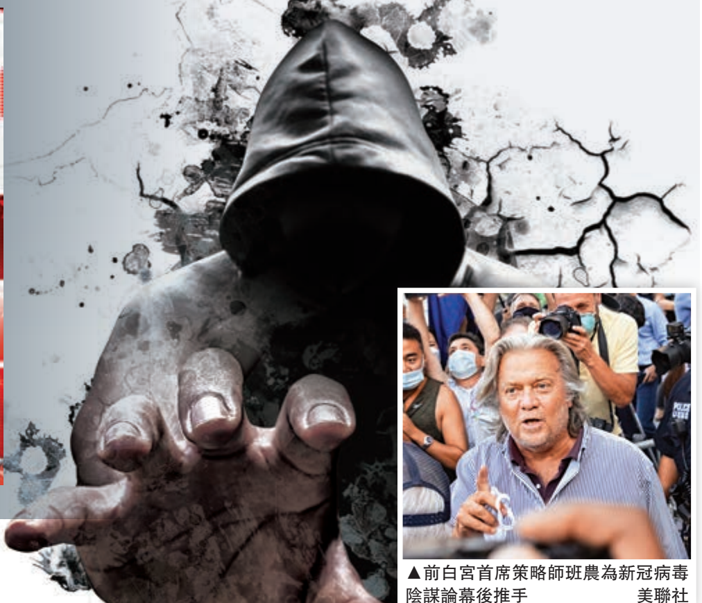
▲前白宮首席策略師班農為新冠病毒陰謀論幕後推手

【大公報訊】綜合美國《每日獸報》、《紐約時報》、《新聞周刊》報道：新冠肺炎疫情肆虐全球以來，一些西方政客和媒體不斷抹黑中國。近日，污衊中國「隱瞞疫情」的前香港大學博士後研究員閻麗夢謊言再度「破產」，其造謠「新冠病毒人造論」的文章遭專家痛批漏洞百出，推特賬號也被平台封禁。有美媒曝出，炮製這場鬧劇的「幕後黑手」，正是反華先鋒、前白宮首席策略師班農。