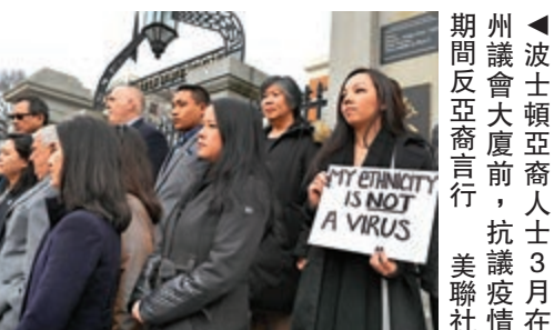
▲波士頓亞裔人士3月間在亞裔商會舉行抗議，抗議疫情期間反亞裔言論 美聯社

中國外交部發言人汪文斌表示，事件反映出美國內反對利用疫情搞污名化、發表種族主義言論的正義呼聲。新冠病毒是人類共同的敵人，世界各國應攜手合作，共同應對這場人類面臨的災難。