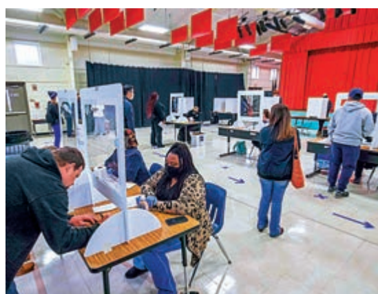
▲北卡羅來納選民3日在一處票站投票

【大公報訊】綜合CNN、BBC、《國會山報》報道：美國總統特朗普拒絕認輸，近期不斷散播大選舞弊陰謀論，美國聯邦政府官員出來公開反駁總統的指控。美國國土安全部轄下網絡安全與基礎設施安全局（CISA）12日發表聯署聲明，指本屆大選是「美國歷史上最安全」的一次選舉，又指無證據顯示，投票系統曾刪除或丟棄、更改選票。這是聯邦和州官員對特朗普選舉欺詐指控最直接的反駁。