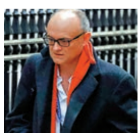
▲英國首相顧問甘明斯擬年底離職

【大公報訊】綜合BBC、中新社報道：英國首相府近日人事變動頻繁，據報首相約翰遜的顧問甘明斯（Dominic Cummings）將在聖誕節前離職。甘明斯是約翰遜最親密的盟友之一，助約翰遜在去年選舉中大勝，亦是英國脫歐背後的主力推手。