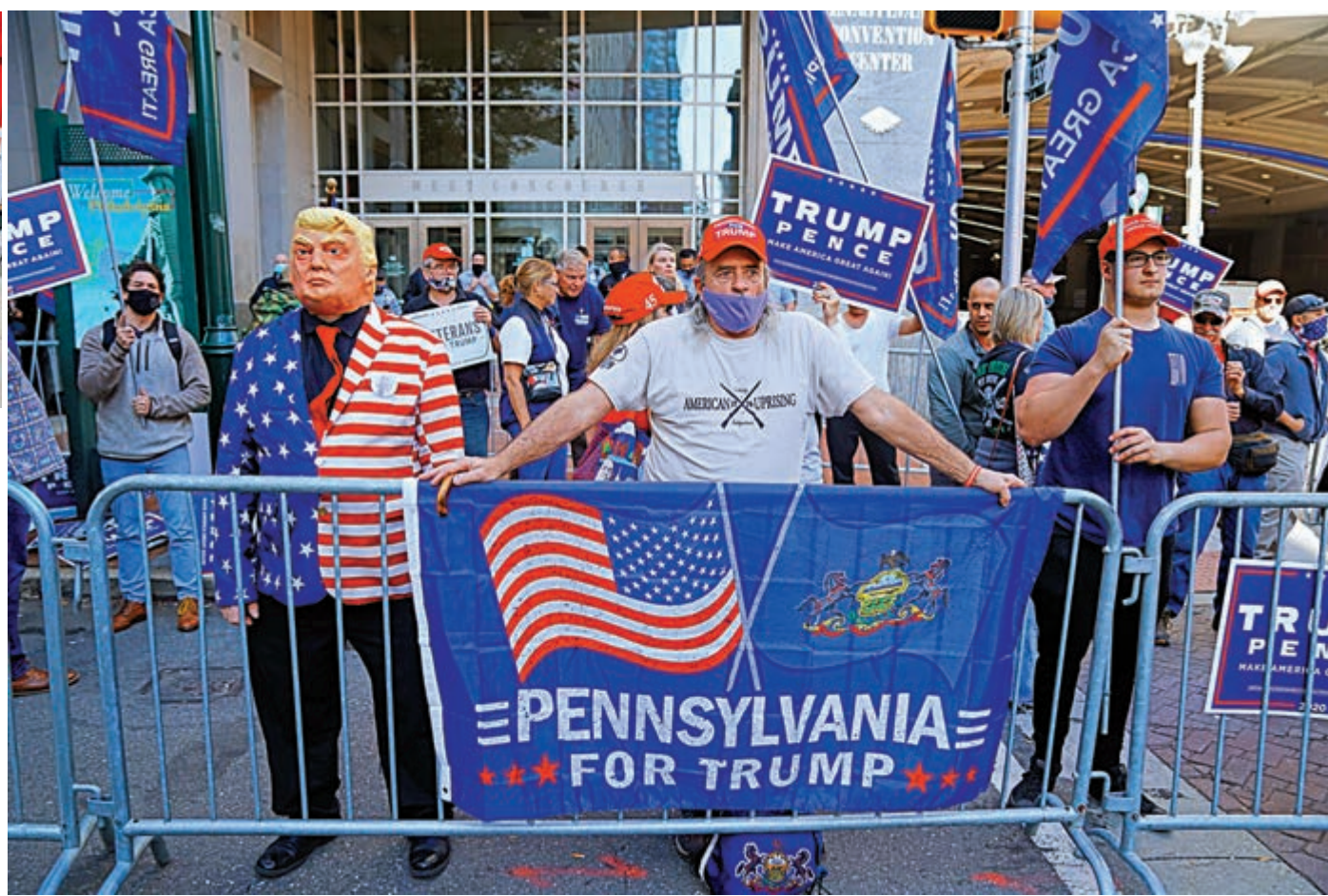
▲特朗普的支持者6日在賓夕法尼亞一處票站外示威

美國總統特朗普12日在推特上暗示，「Dominion」公司開發的投票系統刪掉了屬於自己的270萬張選票，並在賓夕法尼亞等關鍵州份將數十萬票轉給拜登。但他沒有提供證據，推特隨後將此帖打上不實標籤。