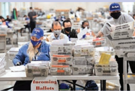
▲加州選舉工作人員對郵寄選票進行分類

【大公報訊】綜合《金融時報》、世界日報報道：美國總統大選投票結束超過一周，已有越來越多共和黨人公開支持拜登贏得大選，呼籲特朗普應接受落敗的現實。