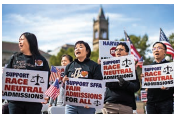
▲示威者2018年在波士頓抗議哈佛大學錄取程序歧視亞裔

的招生慣例合法，雖然招生計劃「並不完美」，但學校無「可行的種族中立替代方案」。SFFA12日表示，他們對裁決感到失望，但並沒有喪失希望，又矢言將會向最高法院提出上訴。有法律專家認為，目前最高法院有保守傾向的大法官佔多數的情況下，可能會終結40年來在高等教育領域允許將種族作為取錄因素的做法。今年10月，美國司法部也對耶魯大學提出類似訴訟，指其歧視亞裔和白人學生。耶魯大學否認歧視任何種族的申請者，並稱不會因為「沒有依據的」訴訟而改變其取錄政策。