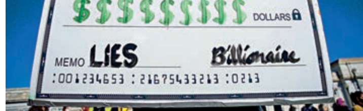
▲特朗普支持者4日在霍士新聞大樓外示威

美國AXIOS新聞網12日報道，特朗普有意進軍傳媒業，或採用網上串流的形式運行以節省成本，並向支持者收取月費。由於眾多特粉是霍士新聞觀眾，將對其收視率造成打擊，「毫無疑問，特朗普計劃搞垮霍士新聞」。