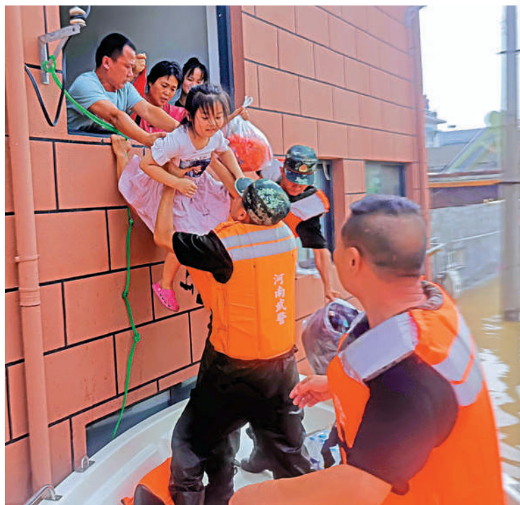
▲武警河南總隊機動支隊100餘名救援人員，在新鄉市牧野區搜救被困民眾，共搜救八百餘人並幫助當地村民轉移。