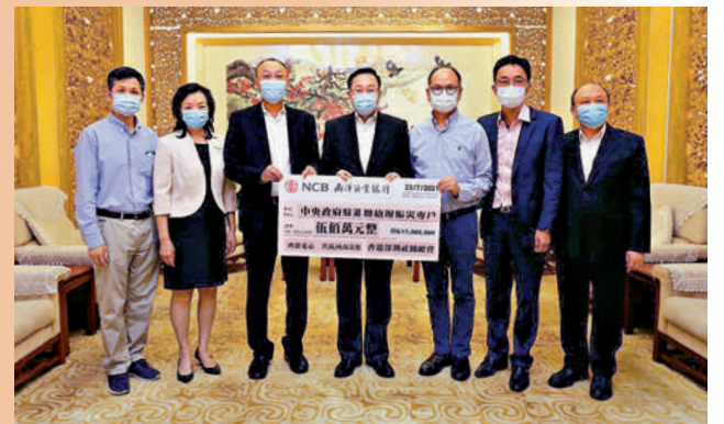
▲七月二十三日，香港深圳社團總會捐款五百萬港元。