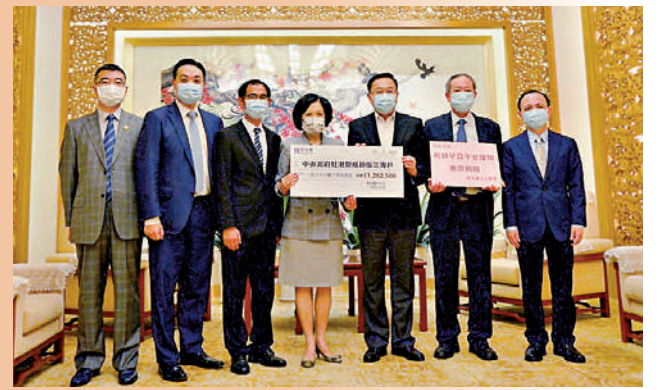
▲七月二十三日，新民主黨捐款一百二十餘萬港元。