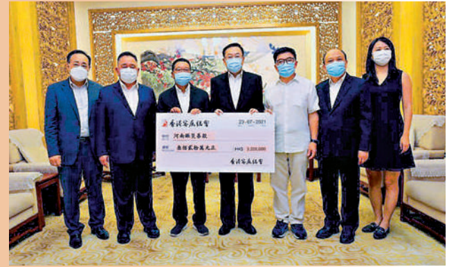
▲七月二十三日，香港客屬總會捐款三百二十萬港元。