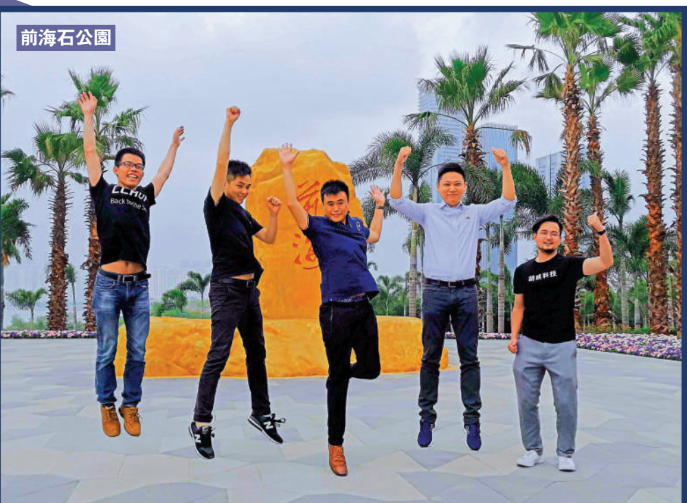
▲《前海方案》讓港青更有信心在前海發展。