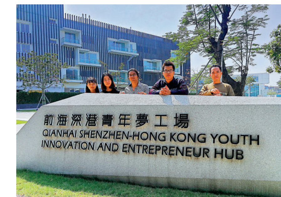
▲前海合作區成立11年來已惠及不少在深發展港青。

【大公報訊】據中新社報道：據了解，成立11年的前海現代服務業合作區，已成為內地與香港關聯度最高、合作最緊密區域之一，在支持香港融入國家發展大局中發揮了「橋頭堡」作用。 11年間，前海堅持「依託香港、服務內地、面向世界」，成為粵港澳大灣區、深圳先行示範區建設新引擎。此一期間，前海全面準確貫徹「一國兩制」方針，推動《內地與香港關於建立更緊密經貿關係的安排》(CEPA) 框架內對港開放措施全面落地，全國首家港資控股的消費金融公司、公募基金公司、合資證券公司、港交所前海聯合交易中心陸續開業，累計註冊港