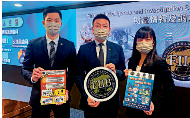
▲財富情報及調查科提醒僱主留意外傭財務狀況，免外傭墮法網。