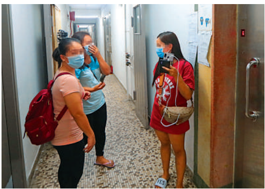
曾有外傭宿舍職員游說外傭借銀行戶口作協助收款用途。

香港僱傭公會主席陳東風認為傭工被利用做傀儡戶口持有人，主要因為傭工們對香港法律的了解及借出個人銀行戶口的風險認知不足，他認為大部分傭工並非有意識地犯法、「借出」或出售銀行戶口，反而是被誤導或利誘居多，以致犯了法仍毫不知情。