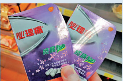
市民蜂擁搶購「心理痛」，連經痛配方也不放過。