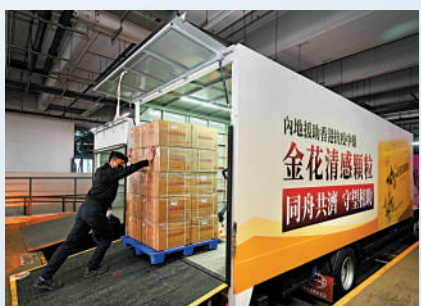
內地早前向本港捐贈大量金花清瘟感顆粒對抗疫情。

他表示，中醫有「肺與大腸相表裏」的說法，因此一些疏通腸胃的藥材，如大黃等均對新冠症狀