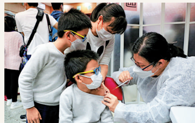
甄女士攜同8歲的孖生兒子接種疫苗。

活動反應熱烈，短短數日便有約800人完成預約。在深水埗街坊福利會外，中午11點前已排起長龍。在大埔藝術中心，接種人數超過300人。立法會議員陳克勤亦到場支持，鼓勵小朋友打針「唔使驚」，為他們打氣。