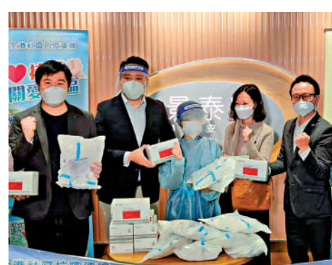
「全港社區抗疫連線」及「香港義工聯盟」昨日聯合發起成立「全港抗疫義工同盟」。