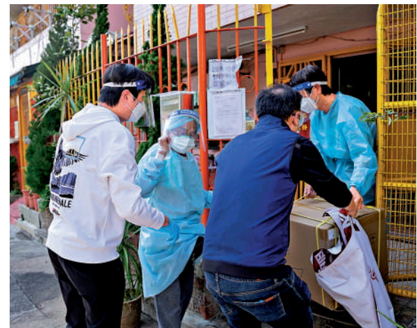
「全港抗疫義工同盟」為安老院舍送上應急防疫物資。

作、盡己所能的工作精神。全港抗疫義工同盟還將於3月10日在全港三區繼續同步舉辦「安老院舍抗疫物資支援計劃」集中活動日，以引起全社會對安老院舍抗疫的關注，推動更多熱心社會公益的人士和義工加入到幫助長者的行列中，同時籌集更多抗疫物資，爭取對全港安老院舍的抗疫物資支援實現「全覆蓋」。除此之外，同盟還關注到安老院舍長者接種疫苗的迫切問題，將進一步加強與特區政府部門的溝通，計劃聯手具有資質的醫療機構，盡快為符合條件的長者提供接種疫苗的服務，為更多安老院舍提供更到位的幫助，為更多長者送上愛心送上溫暖。