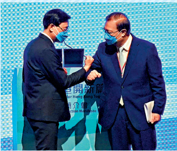
▲李家超（左）在競選政綱簡介會上，與競選辦主任譚耀宗碰手臂互相鼓勵。