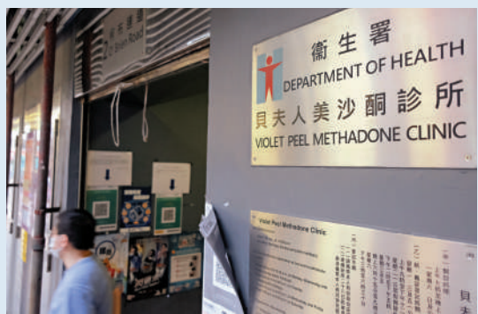
▲下月13日起進入美沙酮診所等13類醫療處所，需出示「疫苗通行證」。

政府發言人表示，有關安排是以病人福祉為最大前提，並不會阻礙有需要病人或傷者接受緊急或急切的醫療服務。長期病患者在感染新冠病毒後，一般有較大風險患上重症，甚至死亡，加上確保醫療處所正常運作是香港防疫抗疫的重要一環，建立保護屏障實屬必要。