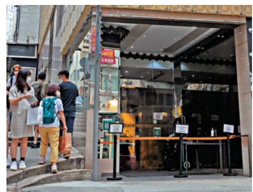
▲懷疑爆發的中環蘭桂坊酒店，有染疫者居住的房間抽氣扇驗出陽性樣本。

昨日累計新增228宗確診個案，包括16宗輸入。全基因組測序分析結果顯示，早前錄得的10宗輸入個案帶有BA.2.12.1變異病毒，累計BA.2.12.1個案達56宗。