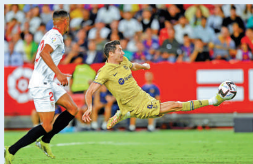
▲巴塞隆納前鋒羅拔利雲度夫斯基（右）飛身射門。

皇馬主場「拆穿」貝迪斯的長勝假象，憑雲尼斯奧斯祖利亞打開紀錄，雖一度被簡拿尼斯替貝迪斯扳平，但下半場洛迪高斯為先收起包括中堅魯迪格、中場卻奧斯等4名主力的皇馬奠定2：1的勝局。