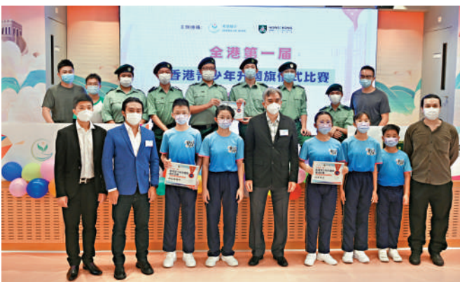
▲團體首辦青少年升國旗儀式比賽，旨在培養香港青少年愛國愛港情懷。圖為中學及小學組冠軍學校學生及嘉賓合影。

有助增加學生對國家的認同感。他勉勵青年人培養國家觀念及國際視野，配合國家「十四五」規劃及大灣區發展，未來走出