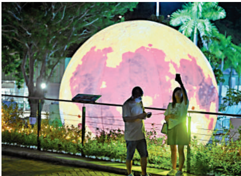
▲香港近日乾燥炎熱，至周六中秋將有驟雨。

展望一道廣闊低壓槽，將會在本周中期為廣東沿岸及南海北部帶來驟雨，一股偏東氣流亦會影響中國東南沿岸，周六(10日)中秋節當日大致多雲，有一兩陣驟雨，溫度介乎27至32℃。