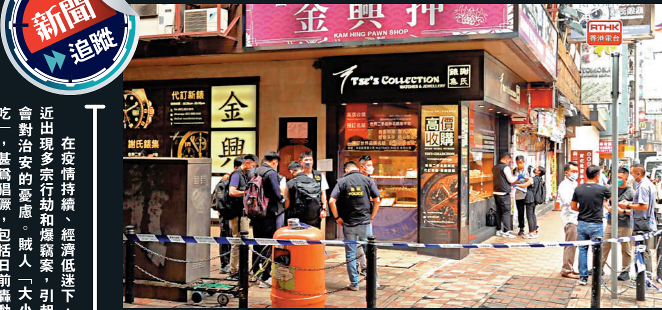
▲上週三銅鑼灣發生1300萬元名錶械劫案，令人憂慮治安惡化。

在疫情持續、經濟低迷下，最近出現多宗行劫和爆竊案，引起社會對治安的憂慮。賊人「大小通吃」，甚為猖獗，包括日前轟動全城的刀槍四匪械劫300萬元名錶案，還有金舖劫案、拾荒婦被搶錢、餐廳學校及診所遭爆竊等，甚至有長者組成爆竊黨連環作案，嚇壞市民。 警方數據顯示，本港2022年上半年各類劫案及爆竊案分別錄得41宗及381宗。有撲滅罪行委員會委員向《大公報》表示，失業率高企難免令「案件嚴重性大咗」，但他相信警隊，會有對應的策略以對付相關罪行，例如加強在鬧市區的監察，以及身穿制服的警員作高調巡邏等。 大公報記者 葉浩源