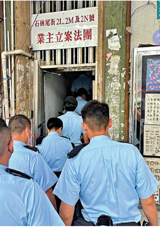
▲深水埗揭發五歲童命案後，大批警員到案發割房單位調查。

深水埗警區助理指揮官(刑事)呂智豪當日傍晚交代案件詳情。警方指出，死者有發展遲緩及情緒問題，易發脾氣，不排除因而發生今次的事件。死者全身由頭至腳有30多處不同傷勢，包括瘀傷、刮損傷，最嚴重的是男童臉部，有多處「紫色黑色的瘀痕」，新傷舊患都有，警方相信有人長時間對男童進行虐待。而警方正調查有無人曾對死者進行虐待，男童的直接死因有待進一步調查。