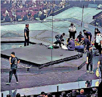
▲MIRROR紅館演唱會嚴重事故將循三方面調查。

楊潤雄表示，一直以來有關關注李啟言的身體情況，希望對方可以早日康復。政府繼續從多方面調查事故原因和責任，包括有否涉及勞工保障、人為疏忽或刑事成分等問題，康文署已成立了小組，主要從技術問題找出