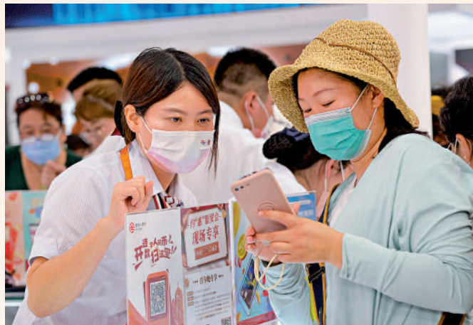
►2023年9月4日，一名參會者（右）在服貿會首鋼園區金融服務展館中國銀行數字人民幣展區諮詢辦理業務。

此外，高精尖產業也是北京的突出抓手之一。北京市商務局黨組書記、局長丁勇對媒體表示，發揮北京科技創新中心和「高精尖」產業優勢，為北京商業的效益提升、動力升級提供科技支撐。大力發展流通新業態新模式，建設智慧商店、智慧街區、智慧商圈，培育壯大智慧零售，有序發展直播電商等「互聯網+」新模式。