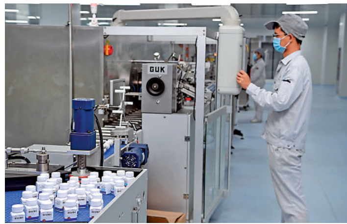
►在陝西一家製藥公司內，員工在中藥片劑自動化包裝線上工作。

談及港企如何參與建設現代化產業體系，他認為，香港可與內地進行科技創新產業合作，依託國內大循環吸引各種生產要素，同時不斷強化國際分工與合作，尤其在粵港澳大灣區建設和構建「雙循環」新發展格局的大背景下，料香港企業應能更好地參與到建設現代化產業體系的過程中。