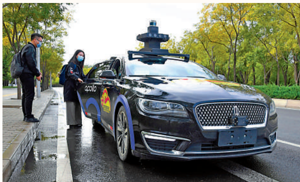
►市民在北京市海澱區稻香湖路的百度自動駕駛出租車指定上車點乘車。

的時候，而且施肥再也不用『憑感覺』了，既不會浪費肥料也不會有農殘，太神奇了。」在這方足球場大小的蔬菜大棚裏，只見棚內自動捲簾機、自動放風機、智能補光燈、高壓噴霧系統、多功能植保機等智能設備一應俱全，農業也插上了智能的翅膀。據悉，在農業領域，百度所設的蔬菜智腦輔助蔬菜種植產量提升10%，商品果率提升15%-20%，水、肥、藥降低了15%。