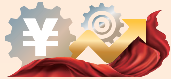
解讀中央經濟工作會議

►「城市大腦」助力城市治理邁入全新時代。2月24日，工作人員在海澱城市大腦智能運營指揮中心技術保障區工作。