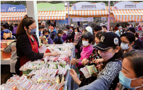
▲工展會今起恢復場內試食，有商戶預計生意可升三四成。

廠商會會長史立德表示，放寬場內試食安排一直是參展商訴求，現時可恢復大家都很开心，預計可帶動整體生意及人流增長10%。但對於曾設立的熟食檔，史立德稱現時展位已經定好，放寬防疫措施後已