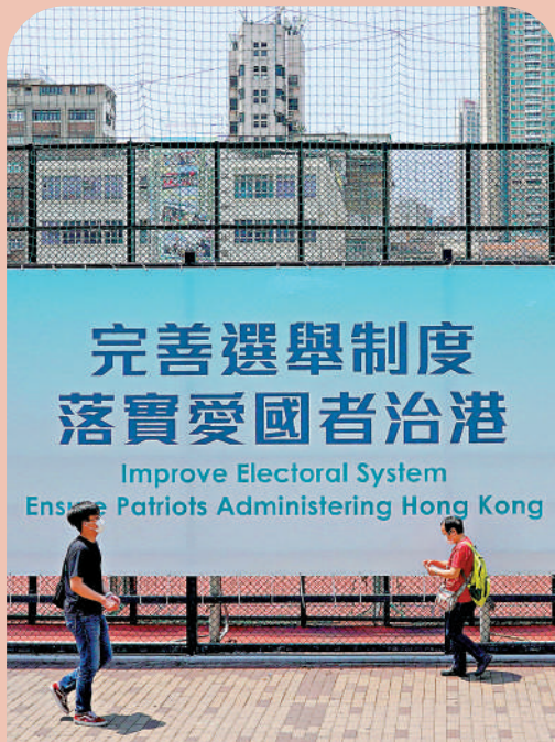
▲區議會重回基本法定位，以維護國家安全為首位，確保全面落實「愛國者治港」。