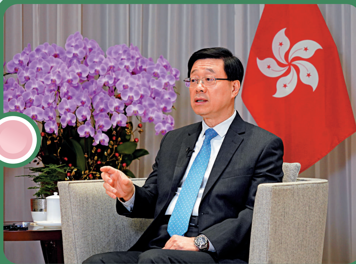
▲行政長官李家超表示，重塑區議會、強化地區治理架構，讓政府推出的政策能令市民受惠。