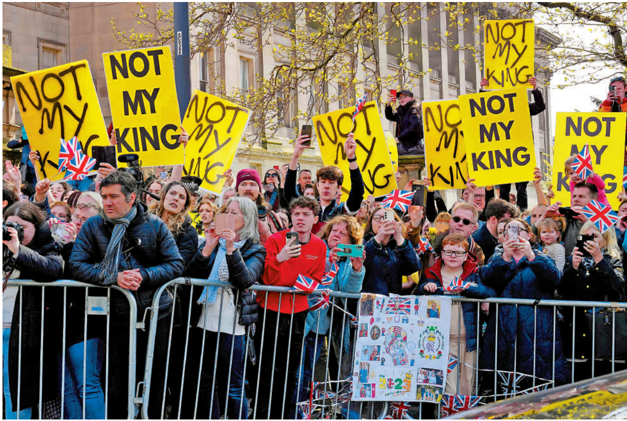
▲示威者計劃在加冕禮上舉「不是我的國王」標語，圖為4月26日的示威活動。