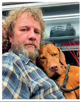
▲►英國男子因向白金漢宮投擲彈藥及持刀被捕。