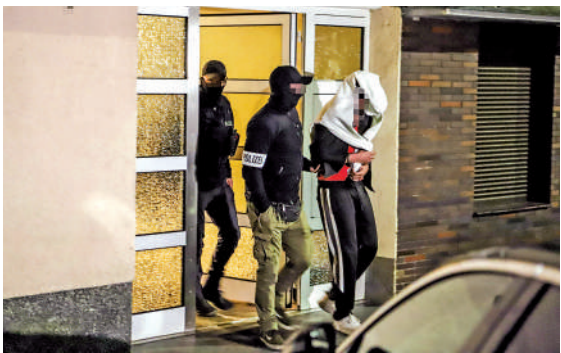
▲德國警方3日在突襲行動中逮捕一名黑幫成員。

今年2月，意大利警方逮捕了一名與光榮會有關的黑幫成員格雷科，他逃亡到法國後隱姓埋名，開設餐廳成為薄餅師傅，因所做的薄餅太好吃而受到當地媒體專題報道，不料這篇報道剛好被一名意大利檢察官看到，於是聯繫國際刑警組織將其逮捕。就在格雷科被捕前幾周，意大利憲兵特別行動組逮捕了潛逃30年的黑手黨頭目馬泰奧·梅西納·德納羅。