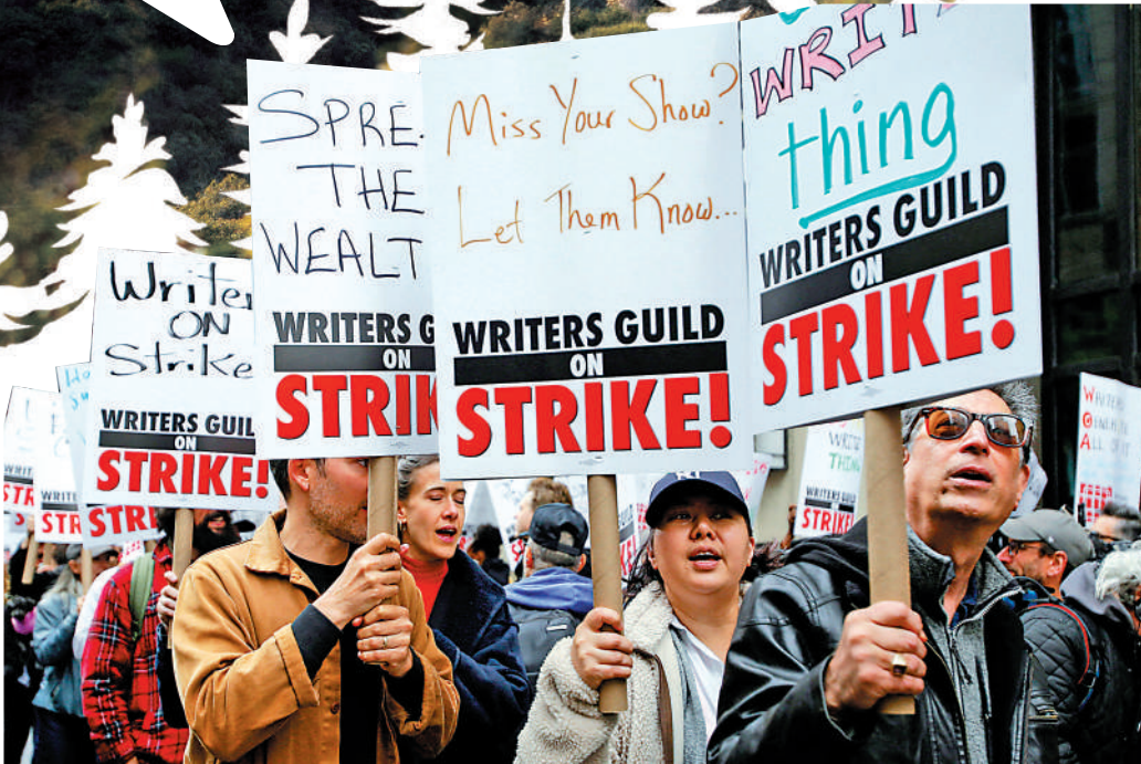
▲編劇2日在美國紐約街頭罷工。