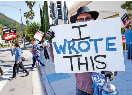
▲參與罷工的編劇2日高舉「這是我寫的」字樣的標語牌。

當前罷工最先影響的是深夜電視脫口秀節目。由編劇為主持人寫獨白和笑話的所有當紅深夜節目立即停工，包括NBC的《占美科倫今夜秀》、CBS的《史提芬高拔深夜秀》等都只能重播之前的節目。同為WGA成員的主持人史提芬高拔表示，「編劇的要求並不過分」。