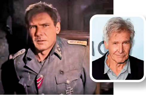
▲80歲的荷里活演員夏里遜福通過AI技術「返老還童」。

奇洛李維斯2月受訪時表示，自20世紀90年代末以來，他的合同中就有防止對表演進行數碼化處理的條款。雖然他明白AI可能帶來的好處，但這對荷里活的創作者來說更像一種威脅，而非福音。