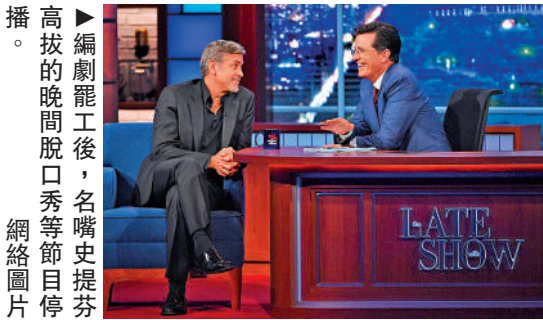
高拔的晚間脫口秀節目停播。

BBC的記者讓ChatGPT分別模仿名嘴占美科倫（Jimmy Fallon），為其深夜節目寫一段開場獨白，內容是有關美國編劇工會（WGA）罷工和AI的笑話。ChatGPT的回答如下：「我不是