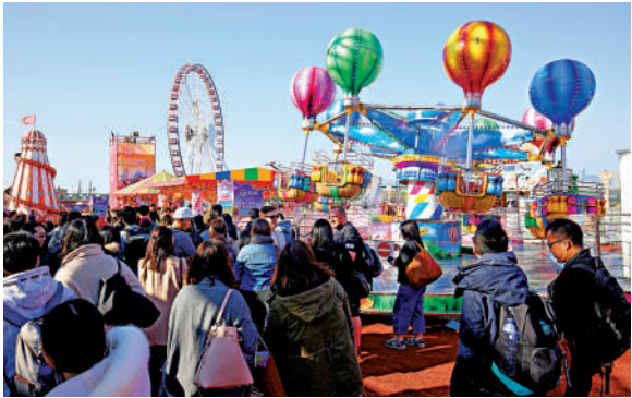
▲中環海濱的「友邦嘉年華」，將於今年12月重辦。圖為過往熱鬧盛況。

昌表示，今次嘉年華規模將較往年更盛大，設有很多不同的遊戲。為響應政府的「你好，香港！」及「開心香港」活動，將贊助及送出摩天輪門票，訪客可一覽維