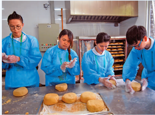
►熊貓義工在「熊貓廚房」，為熊貓準備香甜可口的窩窩頭。