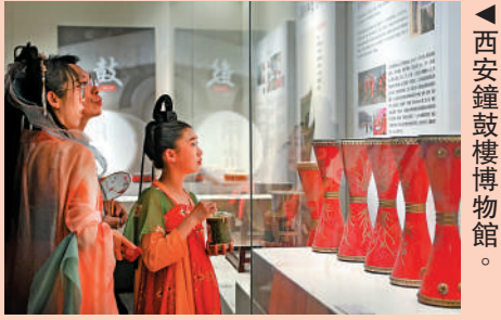
▲西安鐘鼓樓博物館。