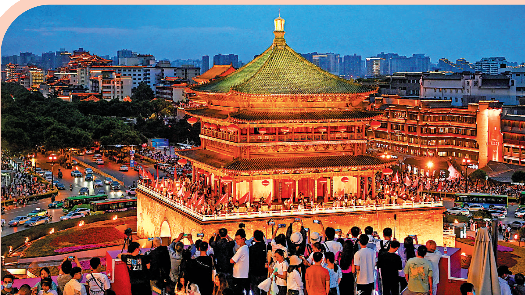
▲5月2日，在陝西西安，遊客在觀景平台欣賞鐘樓夜景。

此外，遠離城市、擁抱鄉村也成為越來越多用戶的假期旅行選擇。攜程數據顯示，「五一」期間，鄉村遊的整體訂單規模達到2019年同期的242%，在鄉村停留3天以上的遊客訂單佔比相較於2019年提升了230%。而今年「五一」鄉村遊訂單中，00後人數佔比超過34%，領先於90後和80後，第一次成為了鄉村旅遊的絕對主力。