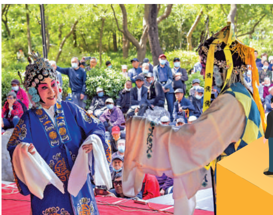
▲5月1日，遊客在山東濟南千佛山廟會上觀賞戲劇。

文化和旅游部總結指出，今年「五一」假期內地旅遊市場呈現四大特點。其一，文化和旅遊產品供給豐富。「五一」假期，內地共舉辦廣場舞、群眾歌詠、「村晚」等群眾文化活動約4.75萬場，參與人數約1.66億人次；1.28萬家A級旅遊景區正常開放，佔A級旅遊景區總數的86%，除北方部分省份因季節性原因外，大部分地區的旅遊景區實現「應開盡開」，內地共舉辦營業性演出3.11萬場次，票房收入15.19億元，觀演人數約865.49萬人次。