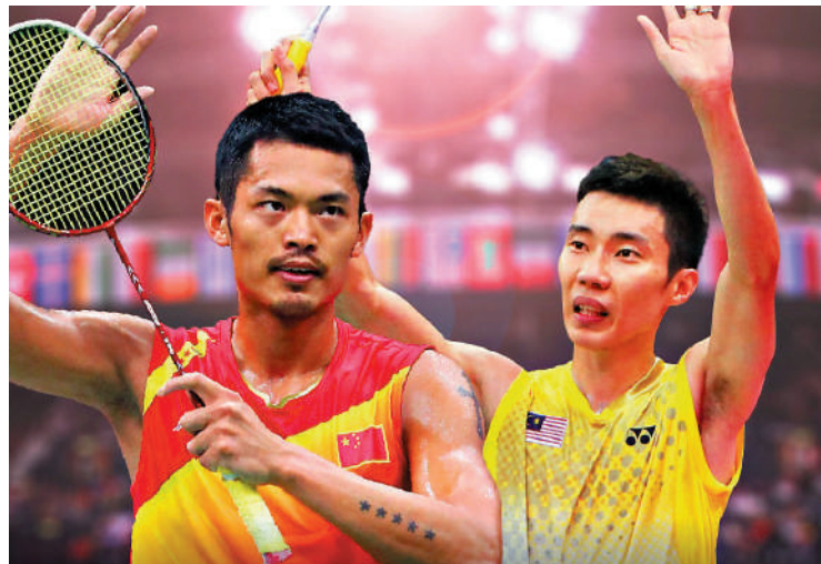
▲林丹（左）與李宗偉是一代羽毛球名將。

林丹是大賽殺手，除贏得兩面奧運金牌外，亦獲得5次世錦賽冠軍。李宗偉則是最動力的球手，贏得47個世界羽聯超級系列賽冠軍，更高踞世界「一哥」位置長達349周紀錄。BWF會長保羅拉森表示，林丹與李宗偉是過去20年來羽球的代表，兩人精彩的表現，吸引更多觀者甚至學習羽球，絕對值得進入名人堂。