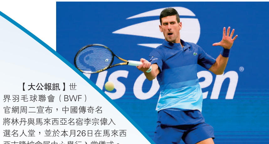
▲35歲的祖高域寶刀未老。