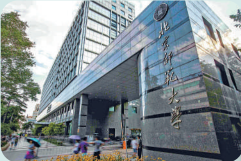
▲北京師範大學中國語言文學類學科傑出校友輩出，包括有諾貝爾文學獎獲得者莫言、知名作家蘇童等。