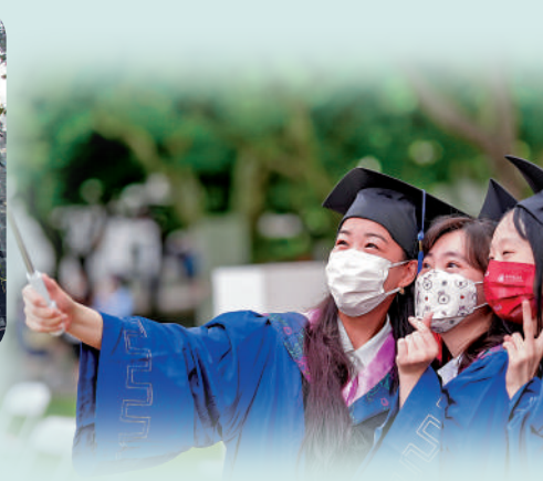
▲華東師範大學漢語言文學專業旨在培養具備文藝鑒賞能力、文化創意能力等人才。