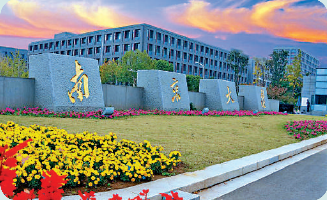
◀南京大學漢語言文學專業注重因材施教，分流培養。