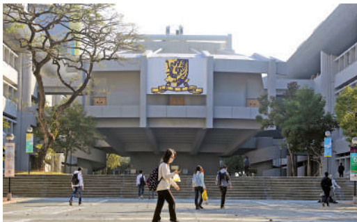
▲中國語言及文學系課程分為語言文字學、古代文獻、古典文學、現代文學四個範疇。

據2021年度統計，該系畢業生約37.9%繼續升學，有60.2%就業，從事行業包括教育、出版、新聞廣播、商業工作等。同學們若以DSE成績申請入讀該專業，最低要求是中文、英文、數學及通識需考獲3分、3分、2分及2分，以及兩個選修科目要考獲3級。