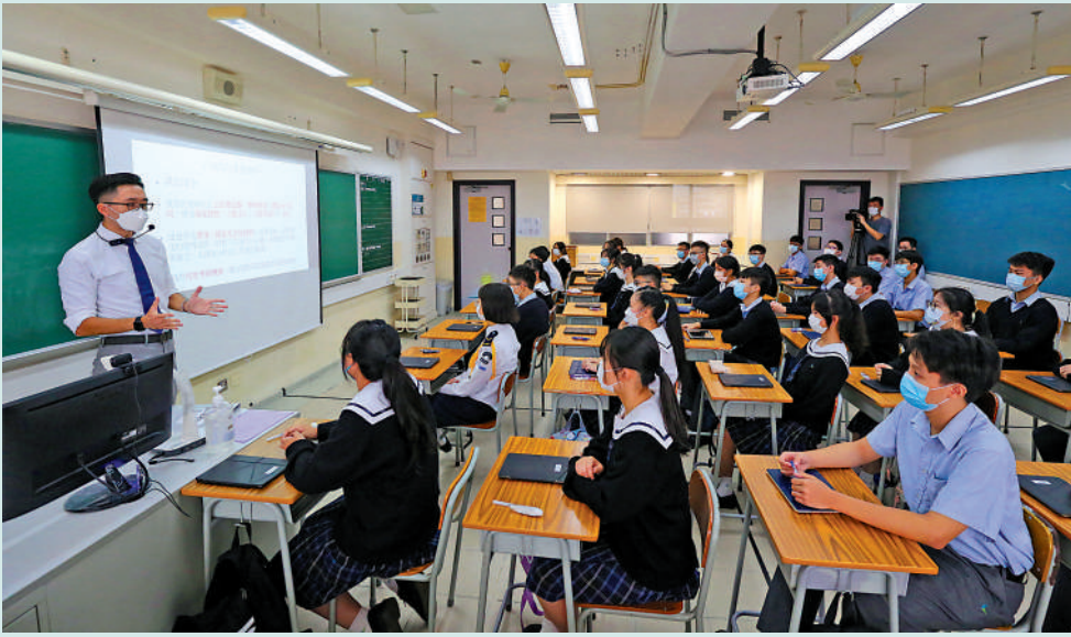
▲修讀語言學的畢業生很多會選擇投身教育行業。

學費（文史、商類）：每年人民幣5200至5720元 住宿費：每年人民幣1200元 生活水平（伙食及雜項）：每月人民幣約1000元