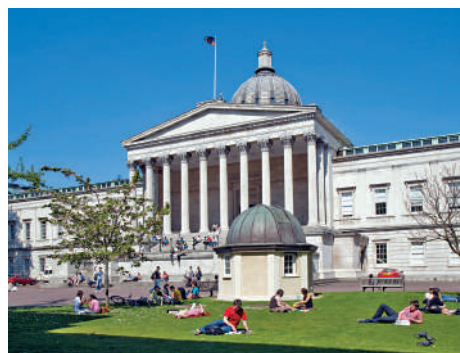
▲倫敦大學學院的語言學在2023年QS學科排名位列全球第18位，在英國則排名第5位。

倫敦大學學院的本部校園坐落於倫敦市中心的布盧姆茨伯里區，接近戈爾街，校園內設有主圖書館、學院劇院、學院附屬醫院等配套。而本部大樓建築十分有名，多部電影曾在此取景。