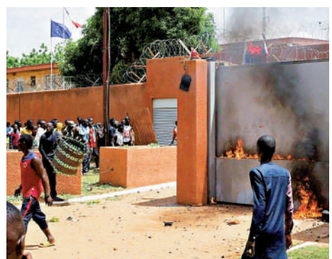
▲示威者7月30日在法國駐尼日爾大使館外縱火。

【大公報訊】綜合法新社、路透社報道：西非國家尼日爾7月26日發生軍事政變，支持軍政府的示威者7月30日試圖衝擊法國駐尼日爾大使館，並在使館外縱火。法國警告說，將作出「毫不留情的回應」。尼日爾軍政府7月31日稱，被推翻的原政府已「授權」法國對尼日爾總統府進行打擊。法國外交部既未證實也未否認此說法。