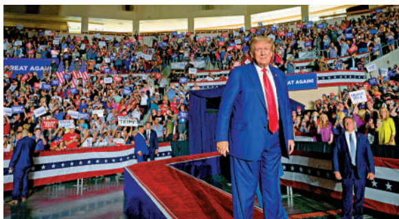
▲特朗普7月29日在賓夕法尼亞出席競選活動。

季度所籌集的資金總額。兩名匿名消息人士稱，特「拯救美國」PAC開銷驟增，為此還要求另一個支持特朗普的組織歸還6000萬美元捐款。《紐約時報》稱，這預示着特朗普競選團隊可能面臨資金危機。