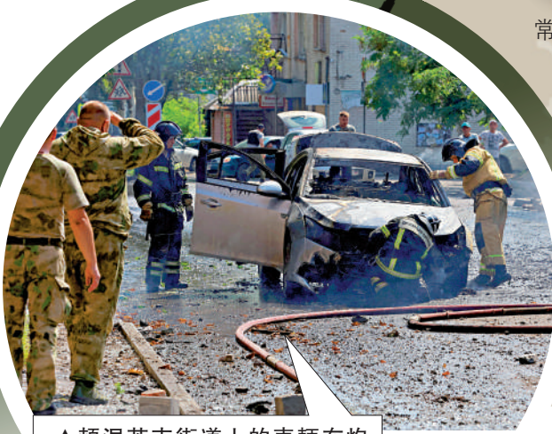
▲頓涅茨克街道上的車輛在炮擊中損毀。

美媒日前披露，沙特計劃於8月5日至6日舉行會議，邀請西方國家、烏克蘭以及印度、巴西等發展中國家參加，但俄羅斯被排除在外。消息人士稱，西方試圖說服發展中國家支持烏克蘭提出的和平方案，包括要求俄羅斯先撤軍、歸還全部被佔領地區和克里米亞等。