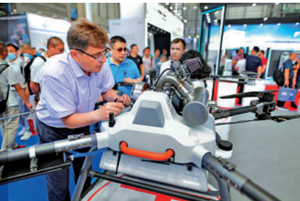
▲外商在深圳展會上關注廣州華科爾QL2000油電混合無人機。

「無論何時何地，當你聽到無人機發出的嗡嗡聲時，聽到的可能是中國製造的聲音。」美國《外交政策》網站（FP）近日如是評價中國無人機的不可替代性。文章指出，如今中國已經成為全球消費級無人機產業的中心。然而一些美國政客對中國無人機的瘋狂打壓，讓美國各領域無人機駕駛員愁壞