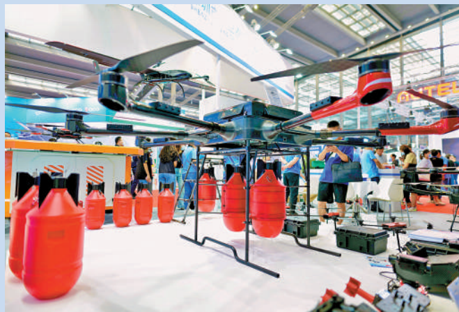
▲6月2日，森林滅火無人機在深圳國際無人機展覽會展出。