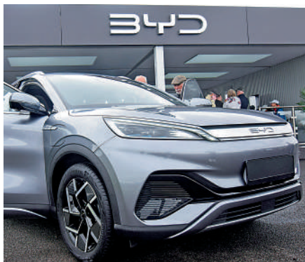
▲比亞迪開拓國際市場業務，進一步提高銷量與競爭力。