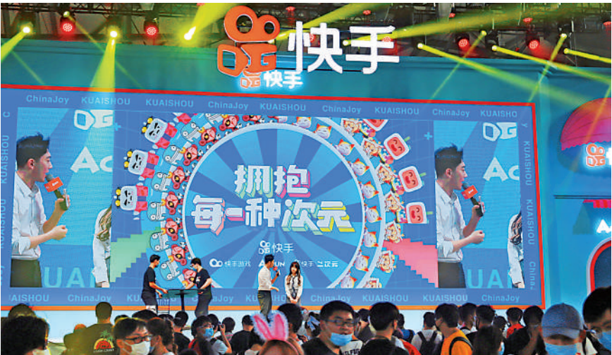
▲資金加速流入港股，百度及快手等中資科網股勢成追捧目標。

同時，去年成立的引進重點企業辦公室已與150間企業會面和商談，當中包括產業龍頭企業和擁有高端前沿技術的公司。據財爺陳茂波在網誌透露，有一定數目的重點企業確認落戶香港，這些公司業務涉及生命健康科技、人工