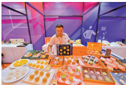
▲不少台商踴躍到大陸尋找商機。圖為最近參會商在天津台企新品採購洽談會上擺放展品。資料圖片

日本政客為一己私利，把核污染水排到大海，危害全人類，可惡之極，而民進黨政客也不違多讓，為了搞「台獨」、為了倚仗美國、日本對抗中國大陸，不惜進口美國瘦肉精豬肉，不惜進口受污染的日本水產，不惜犧牲台灣民眾的健康福祉。這不是「賣台毀台」，什麼才是「賣台毀台」？