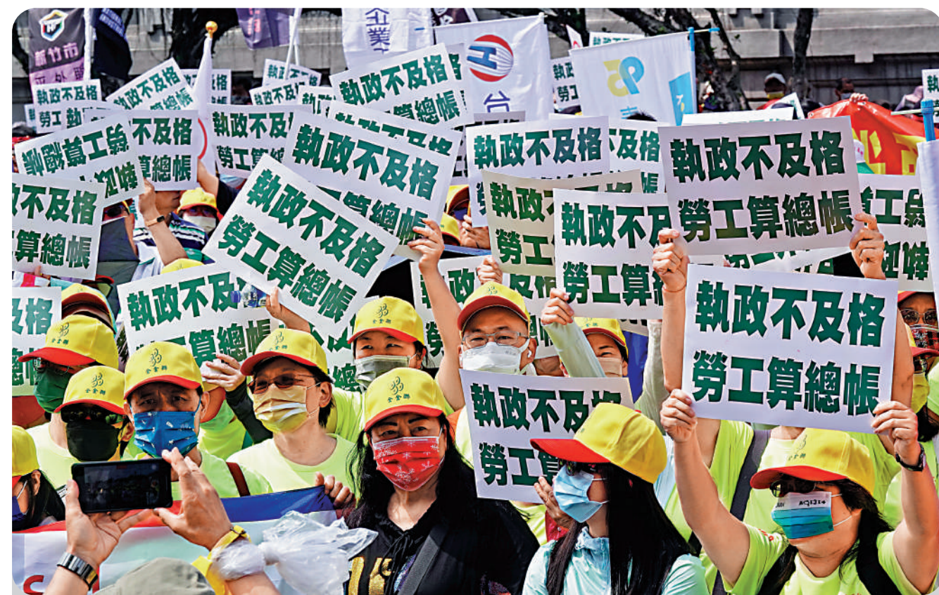
▲台灣勞工團體舉行集會，批評民進黨當局施政不力，無法為勞工帶來福祉。

包承柯指出，郭台銘作為企業家，支持者主要是中部的國民黨勢力和其企業的員工，支持度並不廣泛。雖然他的一些想法可能比較務實，但他仍是政治上的「小學生」，這就是他為什麼在看不到勝選曙光的情況下，仍不願勸告出來參選的原因。