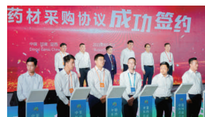
▲中藥材採購協議簽約。