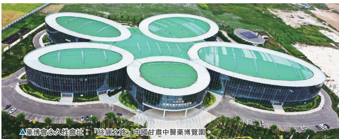
▲博覽會永久會址：「絲綢之路」中國甘肅中醫藥博覽園。