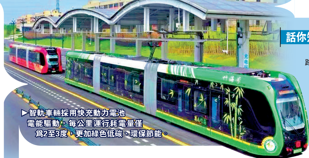
▶智軌車輛採用快充動力電池電能驅動，每公里運行耗電量僅為2至3度，更加綠色低碳、環保節能。