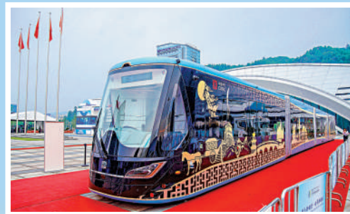
▲2023世界動力電池大會期間，智軌列車亮相相展。

內地最長的智能軌道線路——四川省宜賓市智能軌道快運系統T4線正線（以下簡稱宜賓智軌T4線）目前正在開展試運行。根據《宜賓市中心城區智能軌道快運系統管理辦法（試行）》，智能軌道快運系統工程驗收合格後，運營單位組織的試運行不得少於90天。這意味着6月底開啟試運行的宜賓智軌T4線有望在國慶前夕結束試運行期，並將根據實際情況正式投入載客運營。