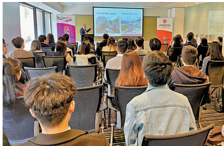
澳洲悉尼今年6月舉行推廣非本地培訓醫生來港工作的招聘日。

高拔陞表示，醫管局人手流失情況近期略為放緩，截至4月底，過去12個月的全職醫生流失率為7.1%，較一月底的7.2%，輕微回落0.1個百分點；全職護士流失率10.9%，較1月底流失率11.2%，輕微回落0.3個百分點。但流失情況仍然令人關注，