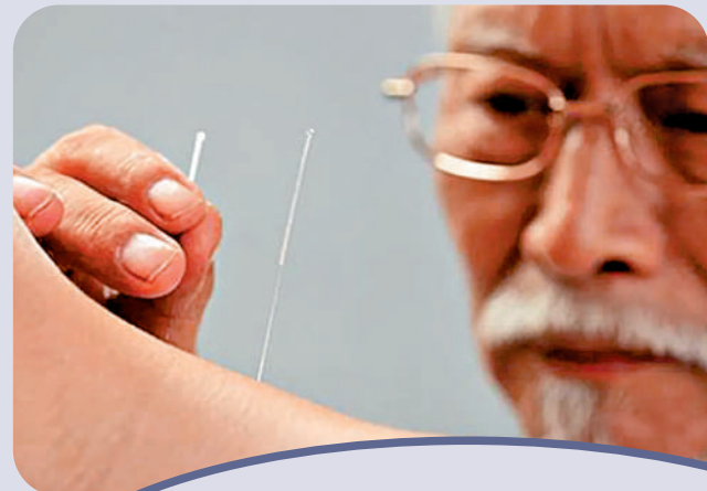
中醫針灸對腦中風及後遺症有良好的療效。

我們看到中醫治療真的幫到他們（新冠患者），巡房時見到很多長者舉起大拇指，說服中藥後，條氣順好多、大便暢通……累積了經驗、見到效果，大家就有信心，最重要是幫到病人。 醫院管理局行政總裁高拔陞