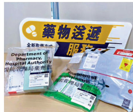
藥物送遞服務已擴展至不同專科門診，並計劃覆蓋不同類型的病人。

由3月6日起，醫管局採用電子醫生證明書，取代傳統的人手簽署紙本醫生證明書。高拔陞表示，醫生證明書數碼化是發展智慧醫院的一個重要里程碑，完善整個遙距醫療服務的流程；電子證明書亦可減少遺失紙本證明書的風險，方便病人存取，提升病人整體的服務體驗。