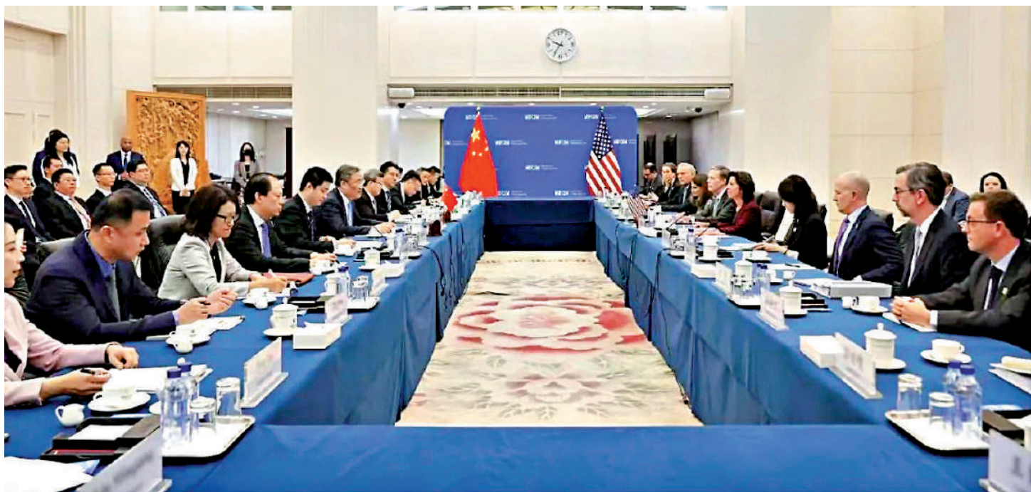
▲8月28日，中國商務部部長王文濤在京與來訪的美國商務部長雷蒙多舉行會談。