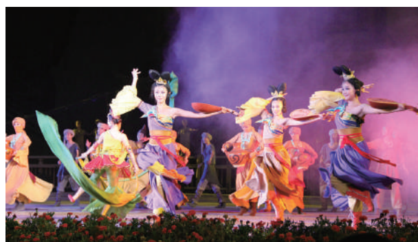
▲敦煌特色文藝演出。