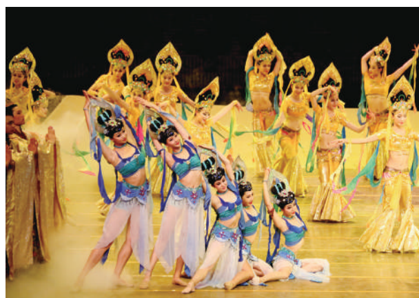
▲舞劇《大夢敦煌》劇照。