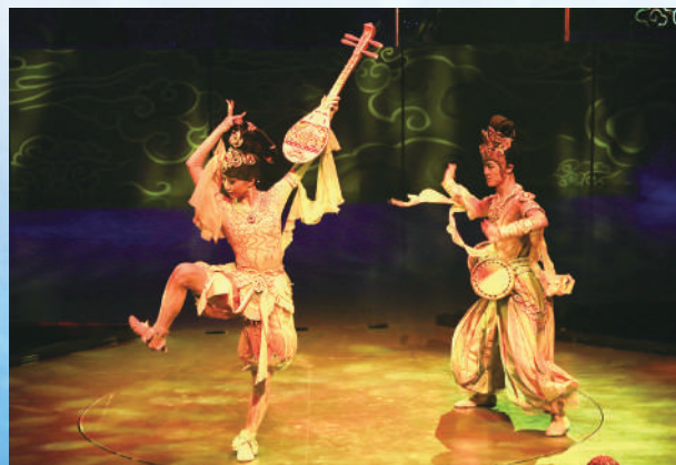
▲全球首部洞窟式沉浸體驗劇《樂動敦煌》劇照。