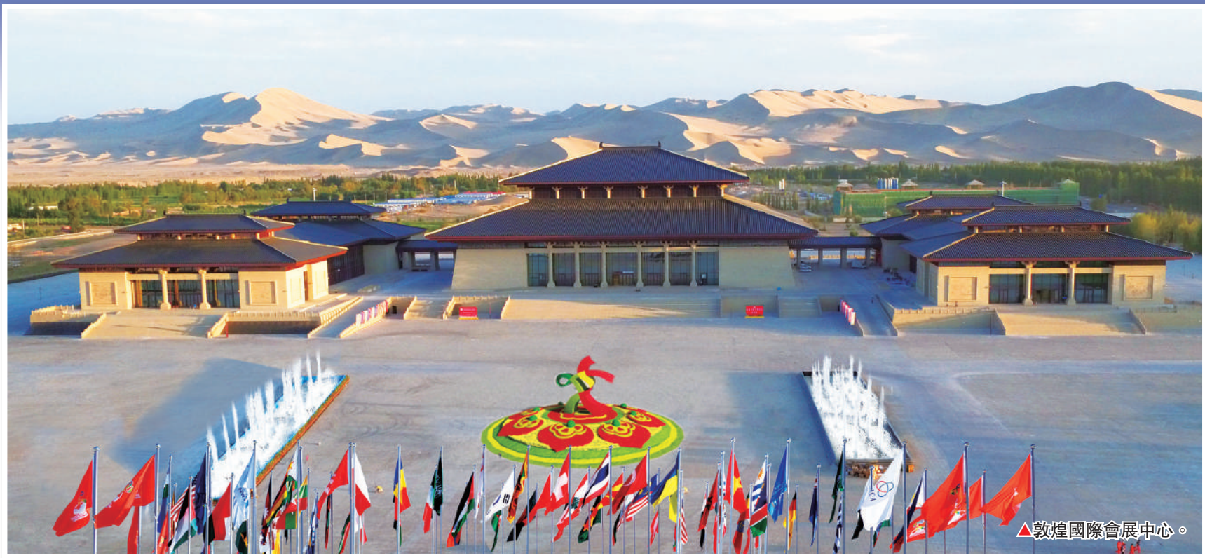
▲敦煌國際會展中心。

9個文化展覽： 主賓國專題展、主賓省專題展、「藝匯絲路—絲路童心」上海合作組織國家兒童畫展、世界文化遺產保護典範和敦煌學研究高地建設成果展、香遠益清—巴基斯坦陀羅藝術展、融貫東西的典範—敦煌文化主題展、絲綢之路繪畫藝術精品展、絲綢之路簡牘文物展、《讀者》品牌專題展。