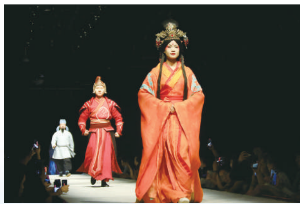
▲大型室內情景體驗劇《又見敦煌》劇照。