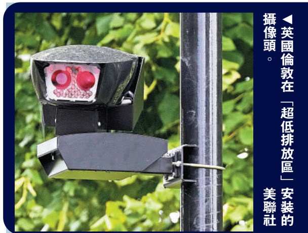
英國倫敦在「超低排放區」安裝的攝像頭。