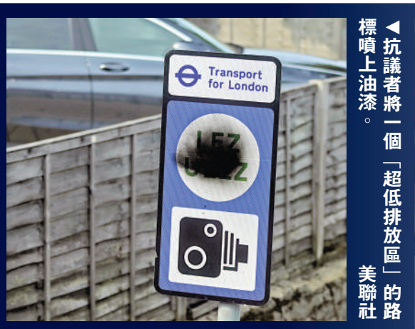
抗議者將一個「超低排放區」的路標噴上油漆。