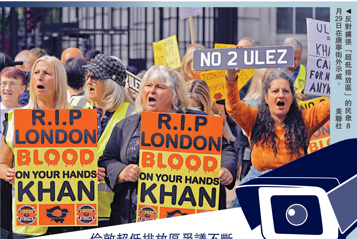
反對擴張「超低排放區」的民眾8月29日在唐寧街外示威。

【大公報訊】綜合路透社、《每日郵報》報道：英國倫敦此前為減少車輛廢氣排放、鼓勵車主淘汰排放超標舊車推出的「超低排放區」(ULEZ)，於8月29日擴展至倫敦全部32個行政區實施，不符合排放標準的車輛將被徵收每天12.5英鎊(約125港元)的費用。另外，政府為實施車輛監測，在全城安裝數千個監控攝像頭。對此，英國民眾表示抗議，批評者指此項收費為通脹環境下的英國人雪上加霜，而加裝攝像頭則是在監控全民。