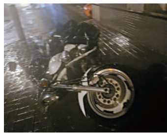
▲鯉魚門道有電車單車被吹倒，橫互路上。

昨日下午仍有少數人到銅鑼灣逛街，當中不乏正在香港旅遊的遊客。來自江蘇無錫的張女士向大公報記者說，外甥女考上香港中文大學，但因電腦出問題需維修，又怕耽誤過幾日開學，唯有於颶風天乘港鐵到銅鑼灣維修，「我們一家人前幾日剛來港，老家不近海邊，沒感受過這麼強的颶風，出門也順