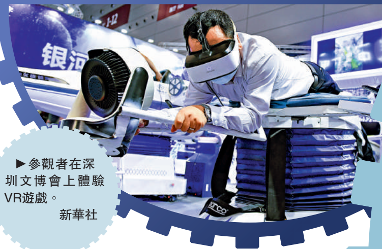
參觀者在深圳文博會上體驗VR遊戲。

今年以來，河套深圳園區批量引入高端人才領銜的項目和企業，涵蓋生物醫藥、新材料、大數據及人工智能、集成電路等前沿領域。目前，河套已落地高端科研和產業化項目150餘個，形成覆蓋國家重大科研平台、世界500強研發中心、香港高校科研項目、突破核心關鍵技術項目、深港獨角獸企業、港澳青年創新創業平台的科創產業集群。