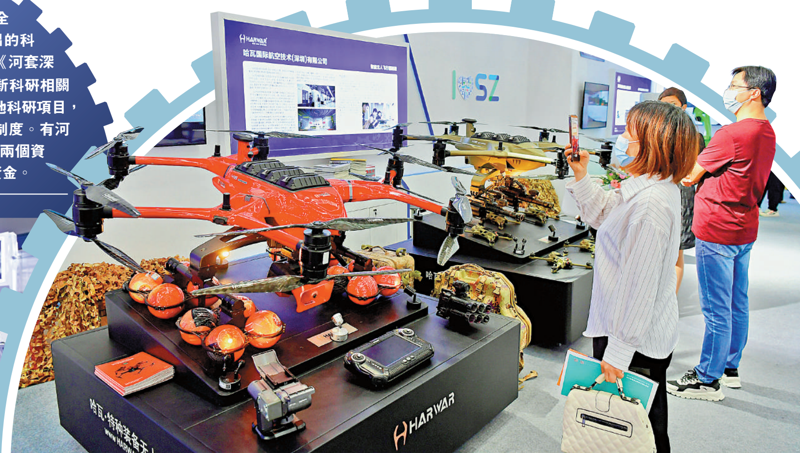
▲河套深港科技創新合作區創新規則，打造深港科創合作新引擎。圖為2022年深圳高交會上的無人機展示區。