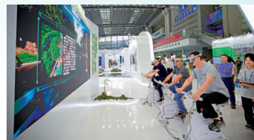
▲7月12日，觀眾在深圳展會上體驗VR暢遊線道。