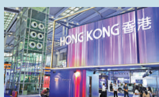
▲2022年深圳高交會上的香港展區。

長達萬字的《河套深港科技創新合作區深圳園區發展規劃》，提到逾60次「香港」。處處體現如何支持香港，如何協同香港，如何圍繞香港，如何服務香港。規劃的初心或者特點，就是要緊緊圍繞協同香港推進國際科技創新中心這一中心任務。深圳園區的初衷和使命，一定是積極推動深港協同發展互補，支持香港融入國家發展大局，要站在這個高度去認識，它不是一般意義上的科技創新平台。